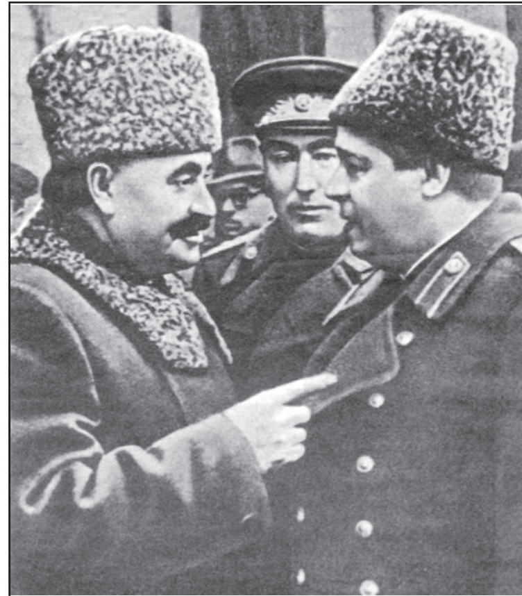
Георгий ДИМИТРОВ беседует с командующим 3-м Украинским фронтом Маршалом Советского Союза Ф. И. ТОЛБУХИНЫМ и генерал-полковником С. С. БИРЮЗОВЫМ.

Для меня и других молодых в то время людей Димитров был живой легендой, примером настоящего революционера. После Лейпцигского процесса, в ходе которого, как известно, он вызвал у своих судей инициативу и превратился в обвинителя Геринга, Геббельса и всей системы фашизма, Димитров стал известен в нашей стране каждому, приобрел