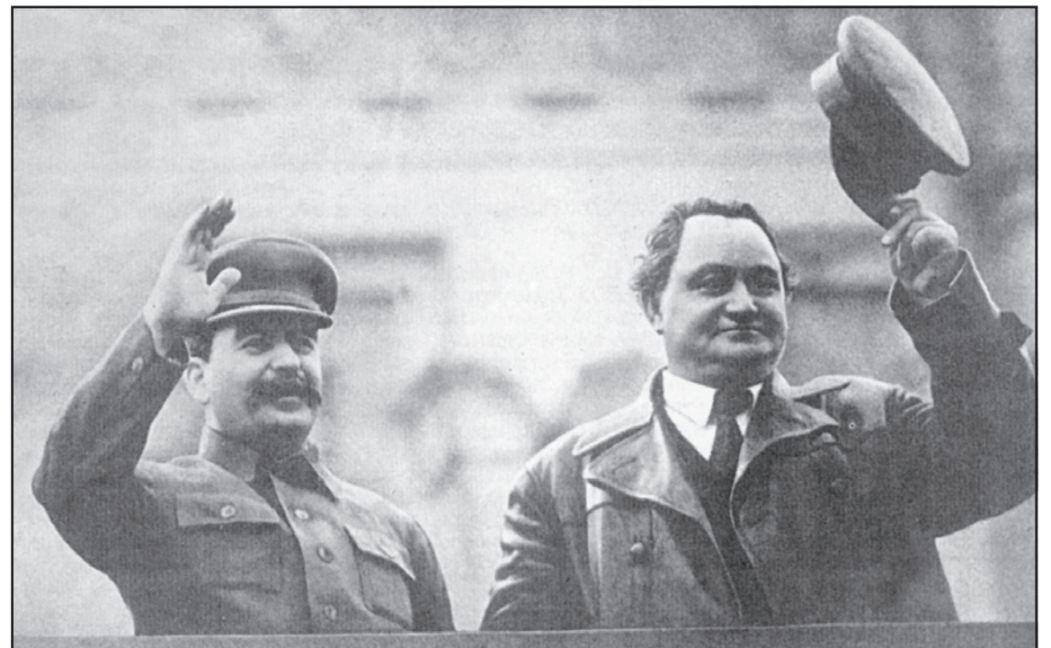
ДИМИТРОВ и СТАЛИН... Они были товарищами, соратниками по борьбе. И не единожды во время советских праздников вместе приветствовали с трибуны ленинского Мавзолея колонны москвичей.

- Я целиком согласен с нашим полпредом, что, кроме трусости Бориса, он желает сохранить и запасной выход: мол, единственный глава государства, не объявивший войну Советскому Союзу, и поэтому достоин снисхождения; может, это позволит сохранить и царский трон.